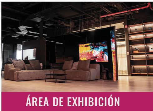
ÁREA DE EXHIBICIÓN

RENTA DE FORO LED PARA EVENTOS CORPORATIVOS