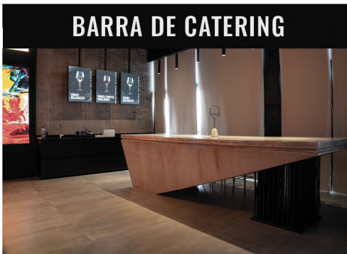
BARRA DE CATERING