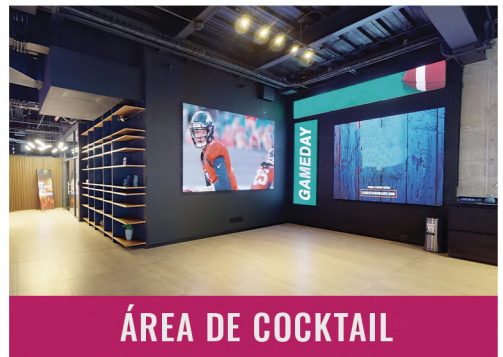
ÁREA DE COCKTAIL