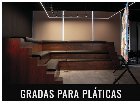
GRADAS PARA PLÁTICAS